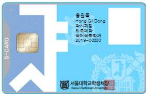
< 앞 면 >