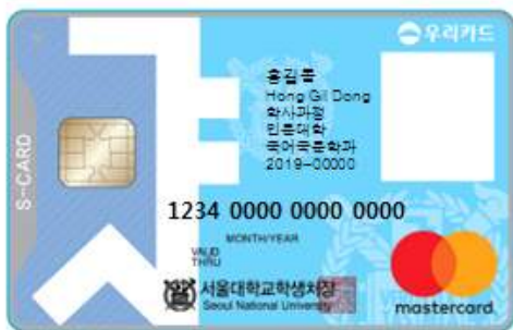
< 앞 면 >