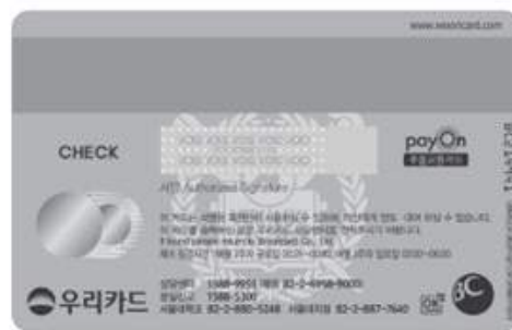
< 뒷 면 >